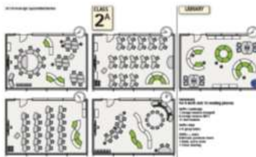
جدول ۲: انعطاف‌پذیری و ضابطه‌های ایجاد آن در مدارس Table 2: Flexibility and establish standards in schools

For example, in the first and second hours of a regular lesson, mixed instruction in small groups of 2 to 9 and a third time is required to work in larger groups. In small schools, there is enough room for group activities, and then preparing flexibility for all three modes.