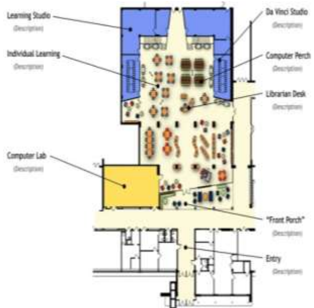
شکل ۱: انعطاف‌پذیری فضاهای بزرگ در مدارس

فضاهای بزرگ امکان جمع‌شدن افراد را فراهم می‌نماید. میزان بزرگی این فضاها با نوع تجهیزات به کار گرفته‌شده در فضا متناسب است. فضاهای بزرگ مناسب کارهای گروهی، عملیاتی (اجرایی) و ورزشی می‌باشد [24].