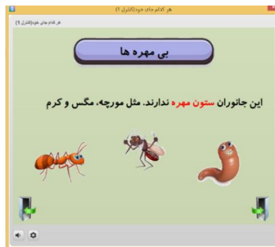
شکل ۱: آموزش چندرسانه‌ای در گروه کنترل Fig. 1: Multimedia training in control group

پس‌آزمون یادگیری: جهت سنجش یادگیری آزمودنی‌ها، از آزمون محقق ساخته استفاده شد. این آزمون شامل ۱۰ سؤال تستی در ارتباط با مبحثی از کتاب علوم (هر کدام جای خود) بود. جهت تأیید روایی و به‌منظور رفع ایرادات احتمالی، سؤالات توسط سه نفر از کارشناسان بررسی شد و بعد از اصلاح نهایی به تأیید آن‌ها رسید. پایایی درونی پس‌آزمون یادگیری از طریق آلفای کرونباخ محاسبه شد و ضریب پایایی آن ۰/۷۳۹ به‌دست آمد.