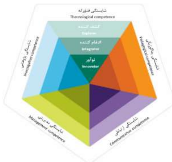
شکل ۲: شایستگی‌های توسعه حرفه‌ای معلمان کلمبیایی [۲۱]

چارچوب شایستگی‌های توسعه حرفه‌ای معلمان کلمبیایی نیز که توسط آموزش و پرورش کلمبیا و در پژوهش فرناندا و همکاران ارائه شده است [۲۱] دارای ۵ شایستگی برای توسعه معلمان است (شکل ۲).