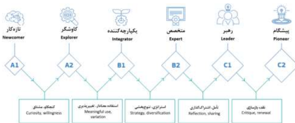
شکل ۵: مدل پیشرفت در چارچوب DigCompEdu [۴]

پژوهش ناپال فریل، پنالوا-ولز و لاکامبرا نیز شایستگی‌های دیجیتال ۴۳ معلم مقطع متوسطه را در ۵ حیطه اصلی و ۲۱ زیرشایستگی، مورد