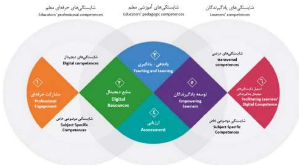
شکل ۳: بخش‌های اصلی چارچوب DigCompEdu [۴]