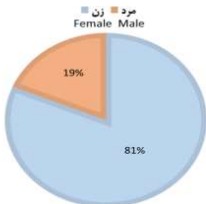
نمودار ۱: شرکت‌کنندگان در پژوهش براساس جنسیت Chart 1: Research participants by gender

در ادامه، یافته‌ها به تفکیک سؤالات پژوهش ارائه شده است. پیش از آن، اطلاعات جمعیت‌شناختی مشارکت‌کنندگان در پژوهش در نمودار ۱ آمده است به‌طوری‌که ۸۱ درصد از مشارکت‌کنندگان زن و تنها ۱۹ درصد مرد بودند.