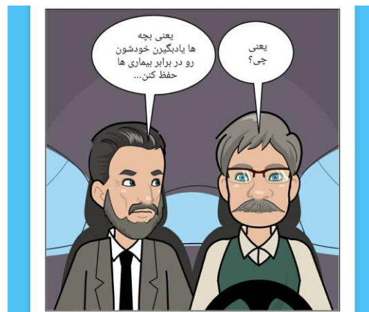
شکل ۱: نمونه کمیک‌استریپ‌های طراحی شده Fig. 1: Sample of designed comic strips

۱۹]. این فرم براساس مقیاس لیکرت ۳ گزینه‌ای (هرگز=۰ گاهی اوقات=۱ زیاد=۲) طراحی شده است [۲۰].