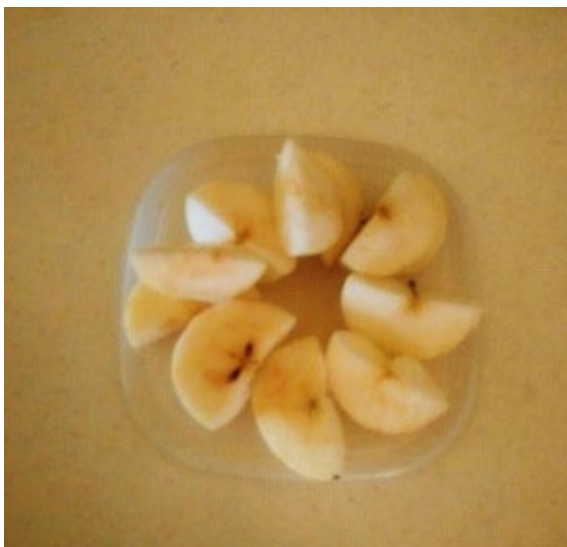
شکل ۲. بشقاب: دانشجویان برش های سیب را به طور منظم در ظرف چیده اند