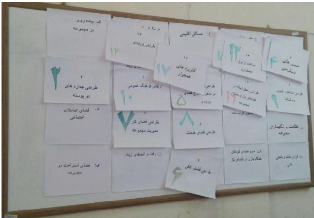
شکل ۶: بازی رابطه راهکارهای طراحی و رفتارهای جاری در نمایشگاه