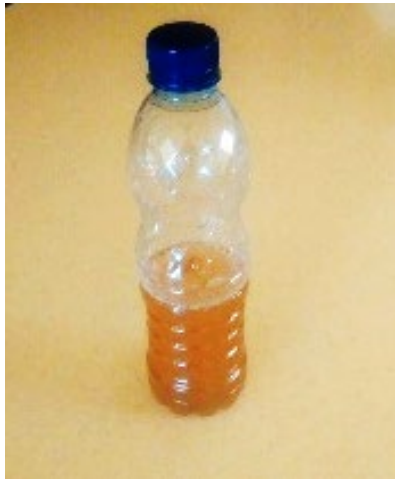
شکل ۱. بطری: دانشجویان سیب را به آب سیب تبدیل کردند.

نمونه دیگری از بازی های طراحی شده در طرح معماری یک، بازی نمایشی صامت بود. هدف از این بازی، آشنایی دانشجویان با تنوع رفتارهای جاری در نمایشگاه بود. بازی به این صورت طراحی شد که