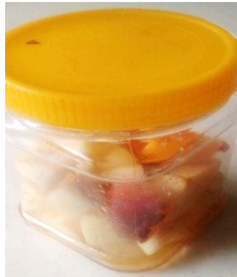
شکل ۴: ظرف درب دار: دانشجویان سیب ها را نامنظم خرد کرده، در ظرف ریخته اند.