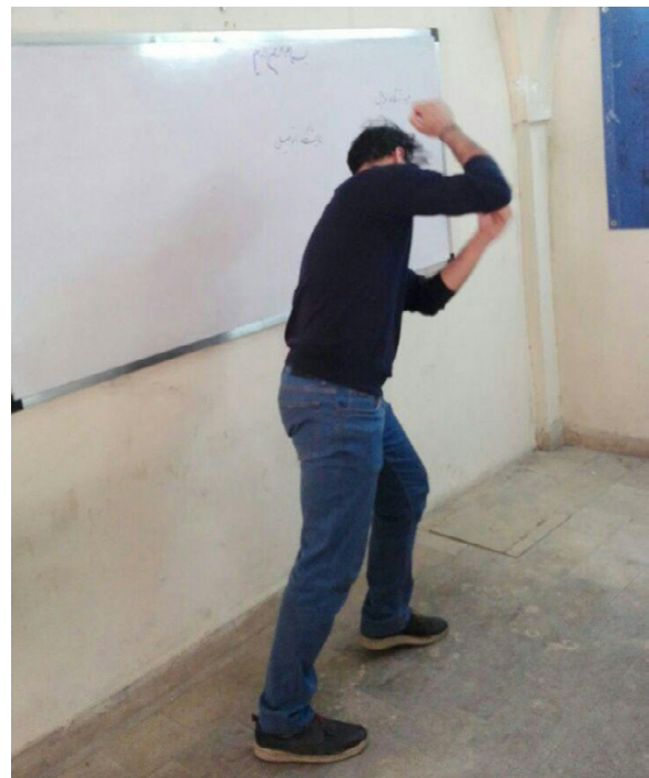
شکل ۵: دانشجو در حال بازی نمایشی برای نشان دادن رفتارها در نمایشگاه

چنان که گفته شد گروه آزمون با روش بازی محور با دو گروه دیگر با روش های معمول کرکسیون جمعی و فردی با ابزار پرسشنامه MBI-SS مقایسه شد. از میان سوالات پرسشنامه MBI-SS، مقایسه سوالات ۸، ۱۱ و ۱۴ که به ترتیب در مورد بدبینی نسبت به مفید بودن درس، میزان مشارکت موثر در کلاس و ارتقای یادگیری دانشجو بود، در ابتدا و انتهای ترم در سه گروه نشان داد که در گروه آزمون ۸۷،۵٪ و در گروه های دیگر به ترتیب ۶۱،۱٪ و ۱۷،۶۴٪ و در مجموع دو گروه کنترل ۴۰٪