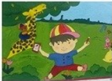
گونه های حیات وحش غیر بومی