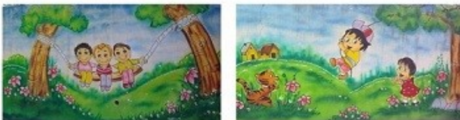
شکستن شاخه ها و توجه نکردن به گیاهان در هنگام بازی

شکل شماره ۲- نمونه ای از مجموعه مفاهیم حوزه (محیط زیست و زیبایی های آن)