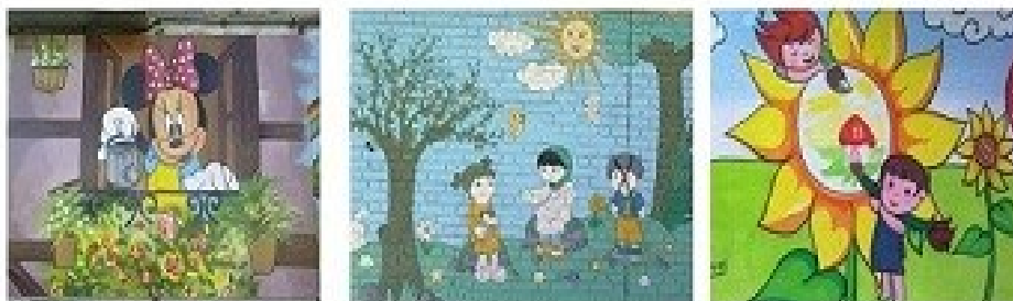
آب دادن گل ها و گیاهان

شکل شماره ۳- مفاهیم نامناسب در حوزه (حفظ و مراقبت از گیاهان) - شکستن شاخه ها