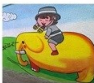
مهارت جمع آوری اطلاعات از محیط زیست