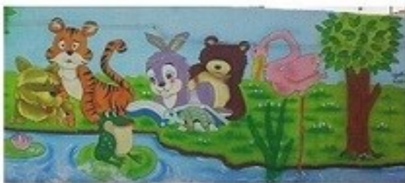
گونه های حیات وحش بومی