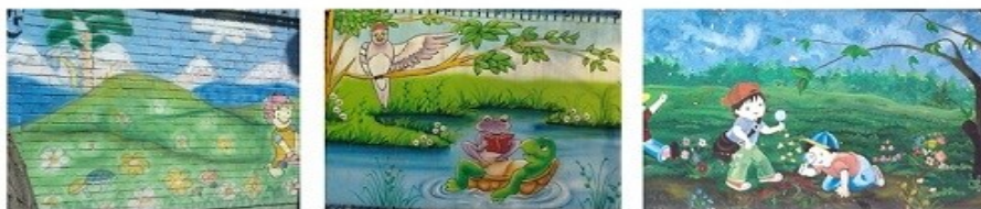
کوه و آسمان

نمونه ای از مجموعه مفاهیم حوزه (محیط زیست و زیبایی های آن)