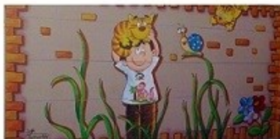
حضور انسان در کنار حیوانات