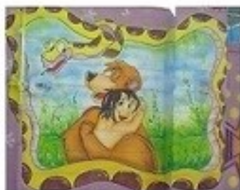
علاقه به حیوانات