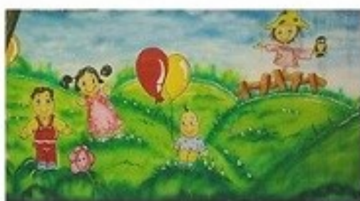
بازی در طبیعت