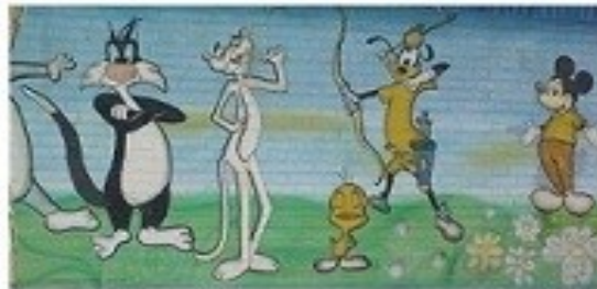
حیوانات موجود در شخصیت های کارتونی (بدون آموزه)