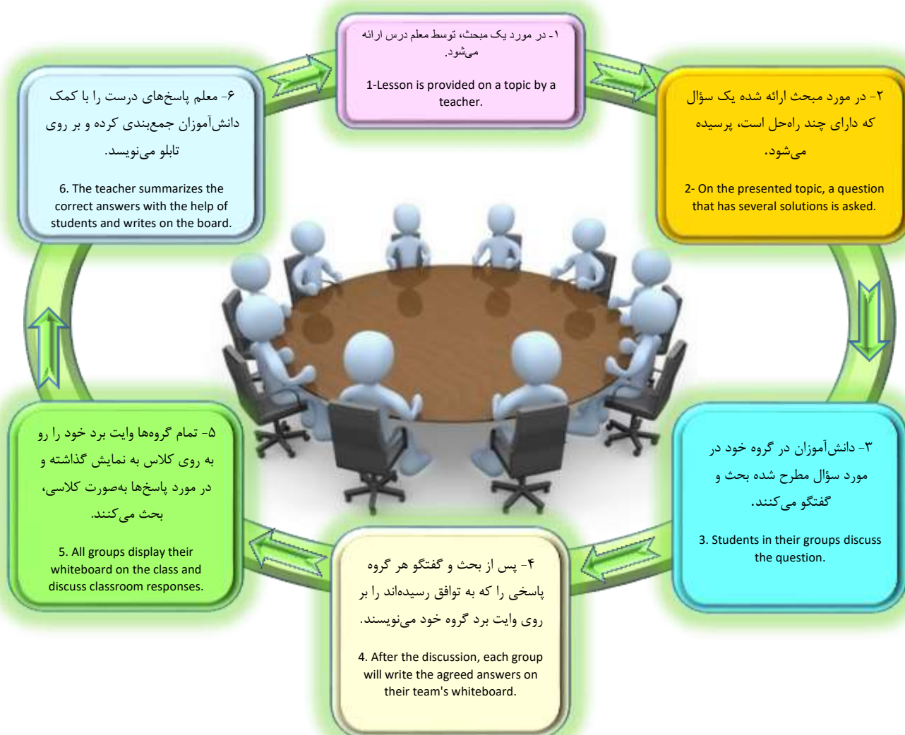
شکل ۲: مدل ترسیمی آموزش مبتنی بر گفتگو به شیوه بحث گروهی. (استراتژی‌های سیلبرمن)

در اجرای تدریس، استراتژی‌های سیلبرمن (Silberman) [۳۵] و راهبردهایی که برای تسهیل بحث‌های کلاسی در درس ریاضی توسط سیدل (Seidel) [۳۶] مطرح شده است، به‌عنوان چارچوب روش تدریس معلم در گروه آزمایشی انتخاب گردید و در سه گام «اقدام»، «کاوش» و «بحث و خلاصه‌سازی» راهبردهای ده‌گانه اجرا شد.