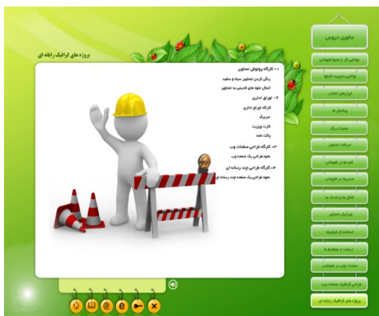
شکل ۱: نمونه‌ای از صفحه طراحی شده در نرم‌افزار چندرسانه‌ای

صورت عملی از ابتدا تا انتها به روش شبیه‌سازی نرم‌افزاری، آموزش داده شدند. در این پژوهش از یک آزمون معلم‌ساخته برای اندازه‌گیری تاثیر چندرسانه‌ای با رویکرد پروژه‌محور بر یادگیری هنرجویان، برای جمع‌آوری داده‌های مورد نیاز تحقیق در دو گروه گواه و آزمایش استفاده شد که این آزمون‌ها به صورت پیش‌آزمون و پس‌آزمون در تدریس سنتی و تدریس چند رسانه‌ای مورد استفاده قرار گرفت. برای نمونه‌گیری در این پژوهش، از شیوه نمونه‌گیری هدفمند استفاده شد. ضمن اینکه جامعه آماری، شامل کلیه هنرجویان پسر پایه دوم هنرستان رشته کامپیوتر شهرستان بیرجند در سال تحصیلی ۲۰۱۳-۲۰۱۴ بود که در مجموع ۸ هنرستان با ۲۰۰ هنرجو را شامل می‌شد. از بین این مدارس یک هنرستان و در این هنرستان دو کلاس به صورت هدفمند انتخاب شدند. حجم نمونه برای گروه آزمایش برابر ۲۵ و برای گروه گواه نیز برابر با ۲۵ هنرجو بود. برای تجزیه و تحلیل اطلاعات علاوه بر روش آمار توصیفی (میانگین، انحراف استاندارد، جدول و نمودار) از روش‌های آمار استنباطی (تحلیل واریانس با اندازه‌گیری مکرر و تحلیل کواریانس) نیز استفاده شده است. البته با توجه به اینکه در این پژوهش از روش نمونه‌گیری هدفمند استفاده شده، لازم است تعمیم‌پذیری نمونه به جامعه مورد نظر، با احتیاط و ملاحظات بیشتری صورت گیرد. جدید بودن پژوهش از جنبه استفاده از نرم‌افزار چندرسانه‌ای همراه با طراحی آموزشی مبتنی بر ساخت‌وسازگرایی پروژه‌محور (PBL) است که برای اولین بار در سال تحصیلی ۲۰۱۳-۲۰۱۴ در بین هنرجویان پسر رشته کامپیوتر شاخه کاردانش هنرستان‌ها صورت گرفت. از آنجایی که محتوای غالب دروس آنها، آموزش نرم‌افزارهای مختلف رشته کامپیوتر می‌باشد، کمتر به جنبه کاربردی و بازاری آنها در نگارش کتب توجه شده است.