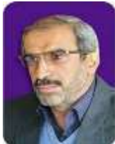
حسین زارع استاد تمام روانشناسی شناختی دانشگاه پیام نور