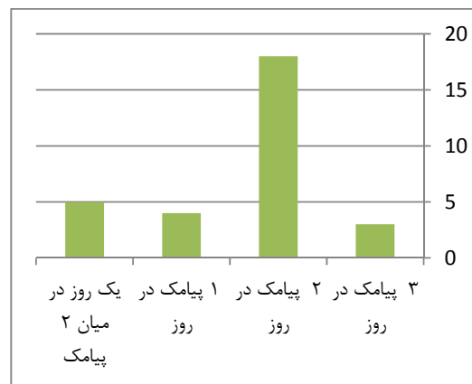
نمودار ۱ اکثر دانش‌آموزان با ارسال دو پیامک آموزشی در روز موافق بودند

در نمودار (۱) نظر دانش‌آموزان گروه دوم این پژوهش در مورد تعداد مناسب ارسال پیامک در هر روز نمایش داده شده است. بیشتر دانش‌آموزان با ارسال دو پیامک در روز موافق بودند.